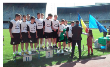
The Chiuești School team on the award podium.