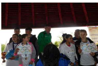
Prize award ceremony. The winners -