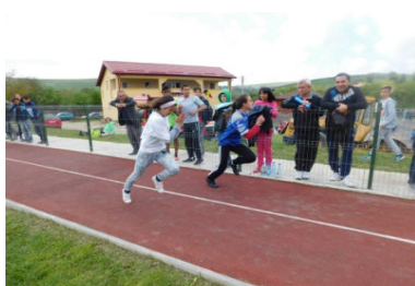
Image during the sprint race.