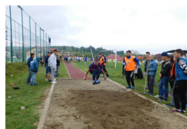
Competitors during the long jump event.