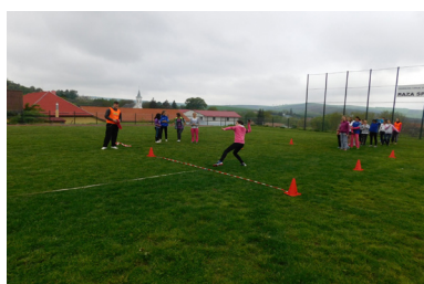
Rounders ball throw