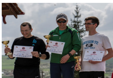
Teachers on the podium: I-Cămărașu School, II-Bonțida School, III-Mociu School.