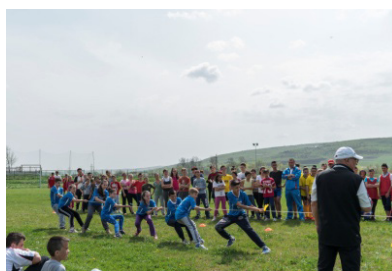
The tug of war event.