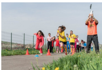
Start of the sprint event.