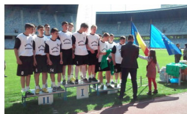
The Chiuești School team on the award podium.